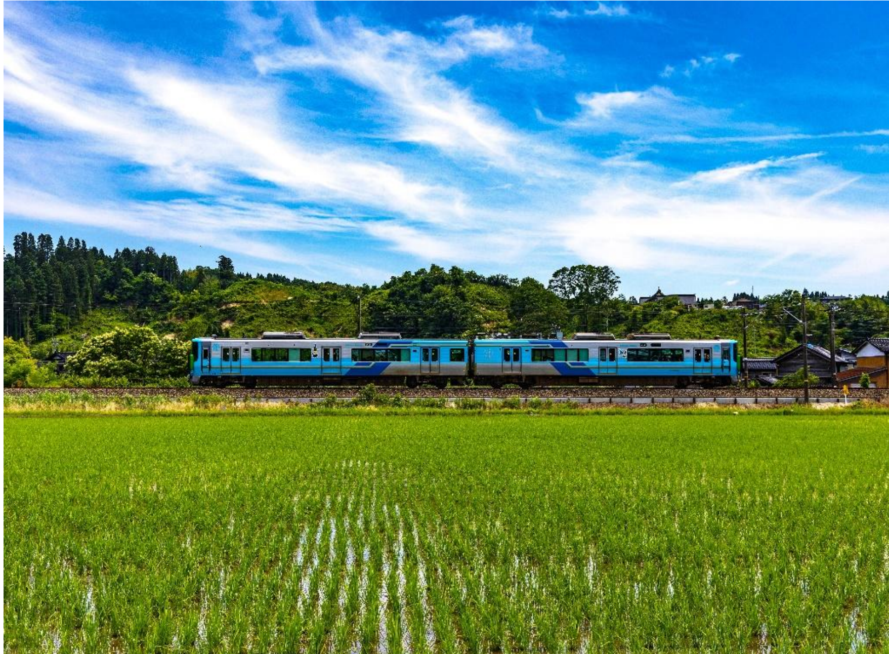
【最優秀賞】 快晴の初夏に行く（川口智章・岐阜県／俱利伽羅～津幡間 2024.6撮影）