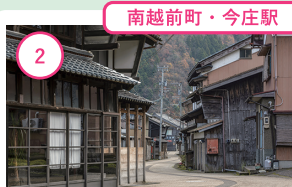
南越前町・今庄駅

2 福井 今庄宿 江戸時代にタイムスリップしたような気分を味わって。北国街道の宿場町