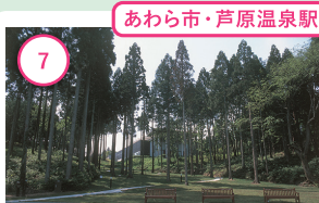
あわら市・芦原温泉駅

2 福井 今庄宿 江戸時代にタイムスリップしたような気分を味わって。北国街道の宿場町