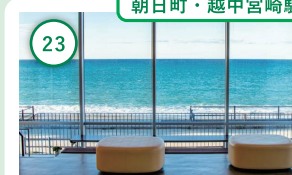
朝日町・越中宮崎駅

18 富山 富岩運河環水公園 立山連峰を望む屋上庭園のある美術館や運河クルーズが楽しめる