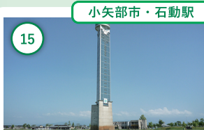
小矢部市・石動駅

15 富山 クロスランドタワー 地上100mの展望フロアから望む散居村やメルヘン建築