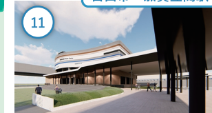
白山市・加賀笠間駅

11 石川 トレインパーク白山 北陸新幹線の車両基地・新幹線技術を紹介2024年3月13日グランドオープン