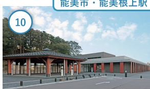
能美市・能美根上駅

5 福井 一乗谷朝倉氏遺跡 ここに蘇る。戦国浪漫「北の京」と呼ばれた中世の大城下町