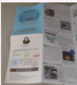
今年度補助事業の例 (森本駅周辺のマップ作成)