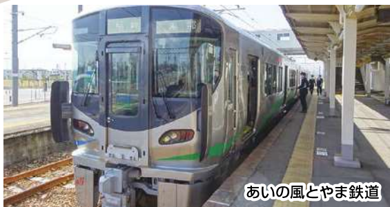
あいの風とやま鉄道